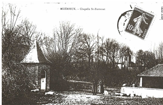
MIZÉRIEUX - Chapelle St-Fortunat